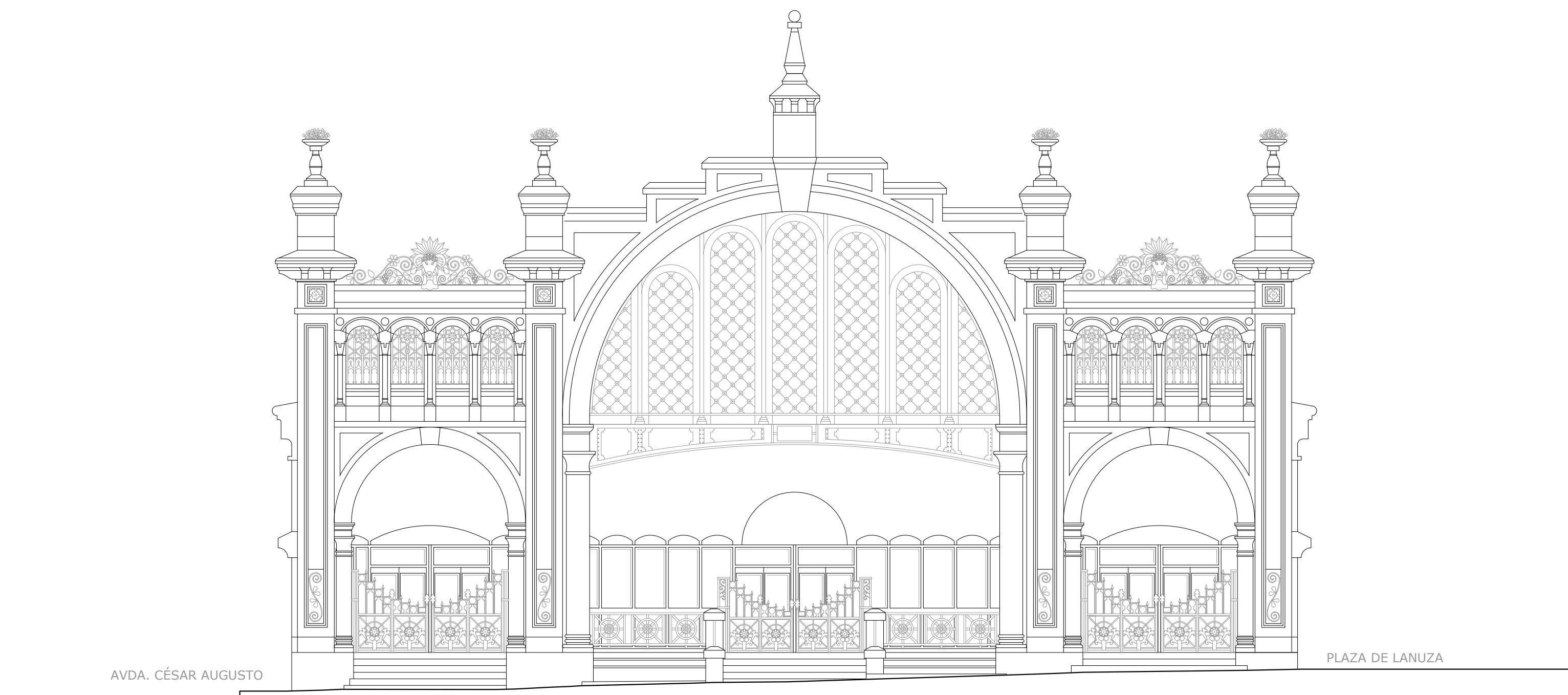
ALZADO TRANSVERSAL SUR